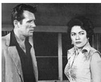
1955 LA FEMME DU HASARD (Flame of the Island) de Edward Ludwig avec Howard Duff