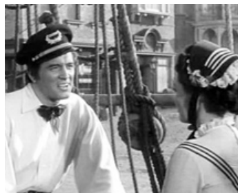
1952 SCARLET ANGEL de Sidney Salkow avec Rock Hudson