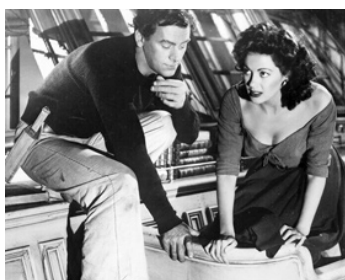
1952 MAÎTRE APRÈS LE DIABLE (Hurricane Smith) de Jerry Hopper avec John Ireland