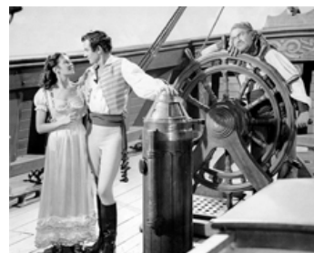
1950 LA FILLE DES BOUCANIERS (Buccaneer's Girl) de F. de Cordova avec Philip Friend