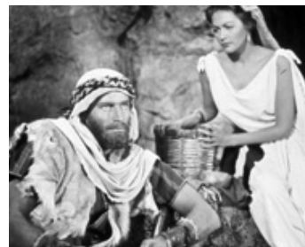
1956 LES DIX COMMANDEMENTS (The Ten Commandments) de De Mille avec Ch. Heston