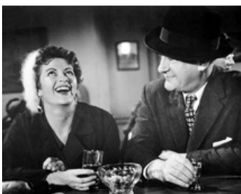
1956 DEATH OF SCOUNDREL d'Edwin L. Marin avec George Sanders