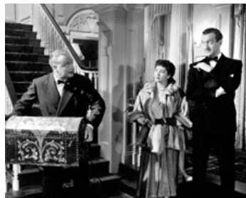
1954 HÉRITAGE ET VIEUX FANTÔMES (Happy ever After) de Mario Zampi avec David Niven