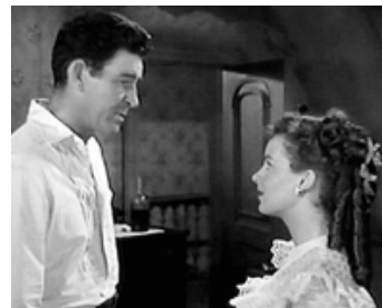
1948 LE BARRAGE DE BLACK BURLINGTON (River Lady) de G. Sherman avec Rod Cameron