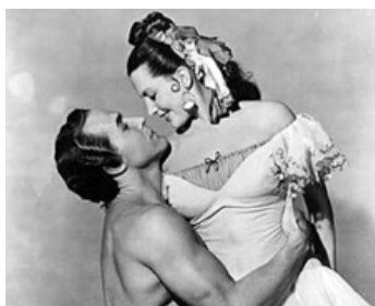
1953 SOMBRERO (Sombbrero) de Norman Foster avec Ricardo Montalban