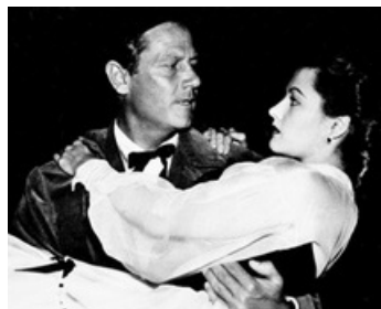
1952 LA MADONE DU DÉSIR (San Francisco Story) de Robert Parrish avec Joel McCrea