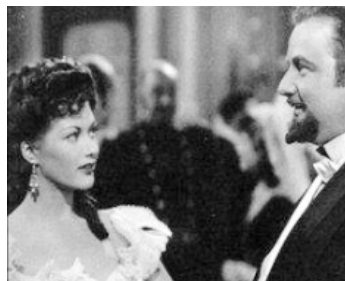
1946 SALOMÉ (Salome when she danced) de Charles Lamont avec Walter Slezak