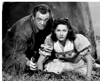
1951 TOMAHAWK (Tomahawk) de George Sherman avec Van Heflin