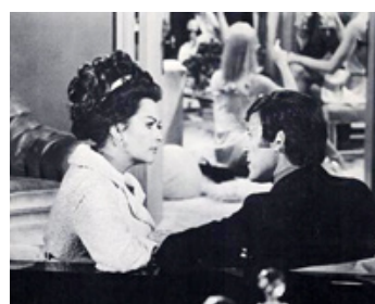
1970 OPÉRATION TRAQUENARD (The Delta Factor) de Tay Garnett avec Christopher George