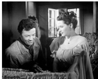
1954 TORNADE (Passion) d'Allan Dwan avec Cornel Wilde