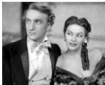
1956 FEU MAGIQUE (Magic Fire) de William Dieterle avec Alan Badel