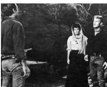
1968 HOSTILE GUNS de R. G. Springsteen avec George Montgomery, Tab Hunter