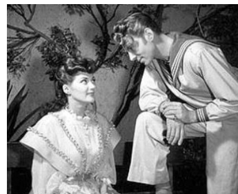
1947 LE CHANT DE SHÉHÉRAZADE (Song of Sheherazade) de W. Reisch avec J.-P. Aumont