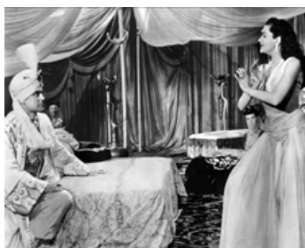
1950 L'AGLE DU DÉSERT (The Desert Hawk) de Frederick De Cordova avec Richard Greene