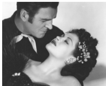
1946 LA TAVERNE DU CHEVAL ROUGE (Frontier Gal) de Charles Lamont avec Rod Cameron