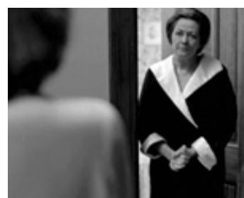
1979 LE SILENCE QUI TUE (The Silent Scream) de Danny Harris