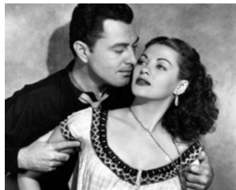
1948 CASBAH (Casbah) de John Berry avec Tony Martin