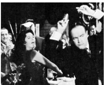
1964 A GLOBAL AFFAIR de Jack Arnold avec Bob Hope