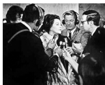
1971 SEPT MINUTES (The Seven Minutes) de Russ Meyer