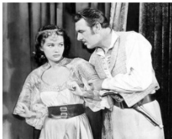
1947 LA BELLE ESCLAVE (Slave Girl) de Charles Lamont avec George Brent