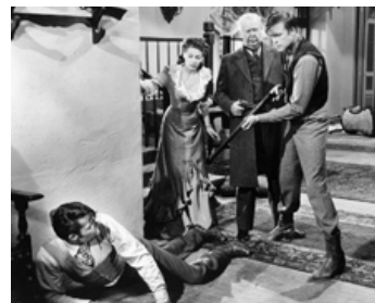
1949 LA BELLE AVENTURIÈRE (The Gal who took the West) de F. de Cordova avec Scott Brady