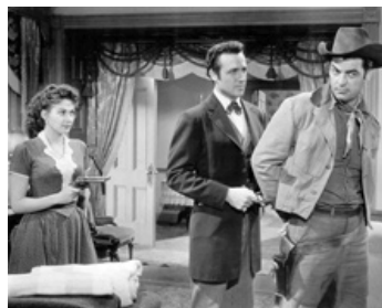
1956 LA PROIE DES HOMMES (Raw Edge) de John Sherwood avec Rory Calhoun