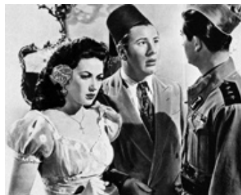
1951 HÔTEL SAHARA (Hotel Sahara) de Ken Annakin avec Peter Ustinov