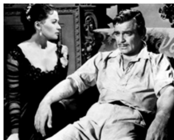
1957 L'ESCLAVE LIBRE (Band of Angels) de Raoul Walsh avec Clark Gable