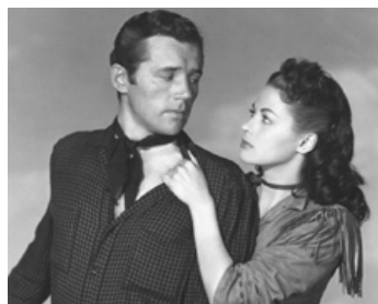
1949 LA FILLE DES PRAIRIES (Calamity Jane and Sam Bass) de G. Sherman avec H. Duff