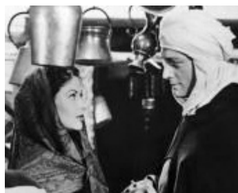
1953 FORT ALGIERS (Fort Algiers) de Lesley Selander avec Carlos Thompson