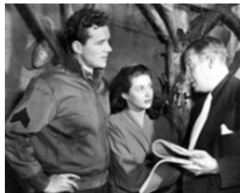
1947 LES DÉMONS DE LA LIBERTÉ (Brute Force) de Jules Dassin avec Howard Duff