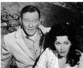
1963 LE GRAND McINTOCK (McLintock) d'Andrew McLaglen avec John Wayne