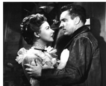
1951 LA VILLE D'ARGENT (Silver City) de Byron Haskin avec Edmond O'Brien