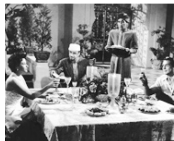
1959 TOMBOUCTOU (Tumbuctu) de Jack Tourneur avec Victor Mature