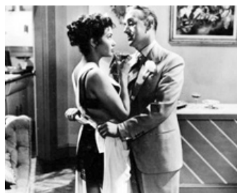
1953 LE PARADIS DU CAPITAINE (Captain's Paradise) d'Anthony Kimmins avec A. Guinness