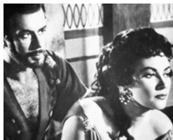
1958 L'ÉPEE ET LA CROIX (La Spada e la Croce) de Carlo L. Bragaglia avec Massimo Girotti