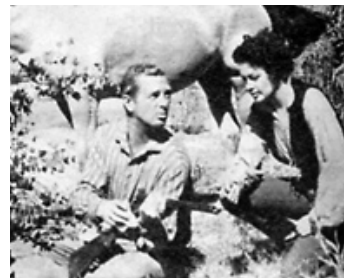
1955 AMOUR FLEUR SAUVAGE (Shotgun) de Lesley Selander