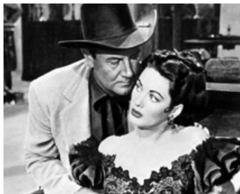
1954 LES REBELLES (Border River) de George Sherman avec Joel McCrea