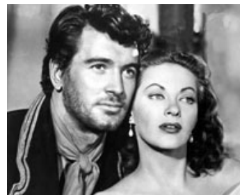
1953 LA BELLE ESPIONNE (Sea Devils) de Raoul Walsh avec Rock Hudson