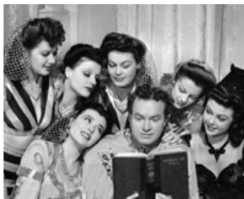
1942 EN ROUTE POUR LE MAROC (Road to Morocco) de D. Butler avec B. Hope (1re geche)