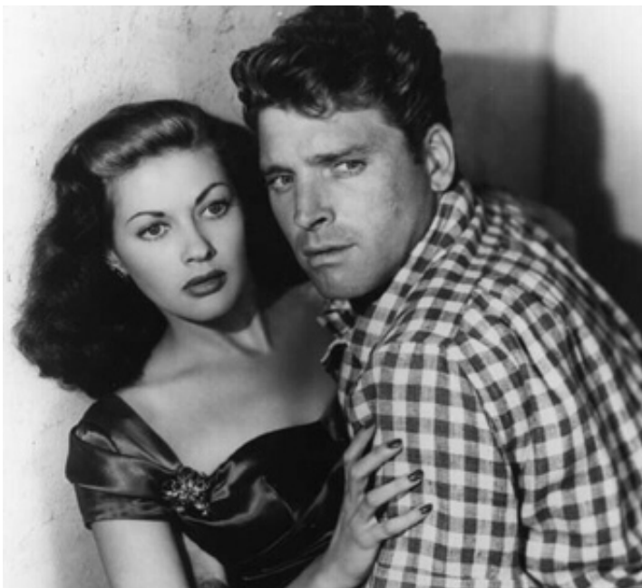
1949 POUR TOI J'AI TUÉ (Criss Cross) de Robert Siodmak avec Burt Lancaster