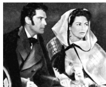
1953 LA CASTIGLIONE de Georges Combret avec Georges Marchal